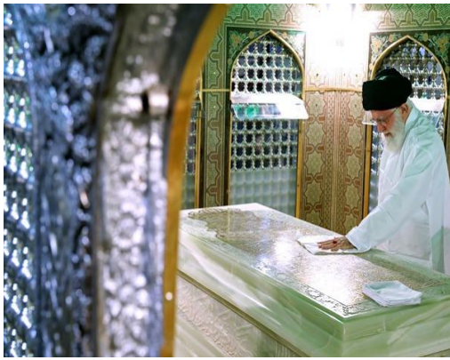
غبارروبی مضجع مطهر حضرت امام رضا (ع)