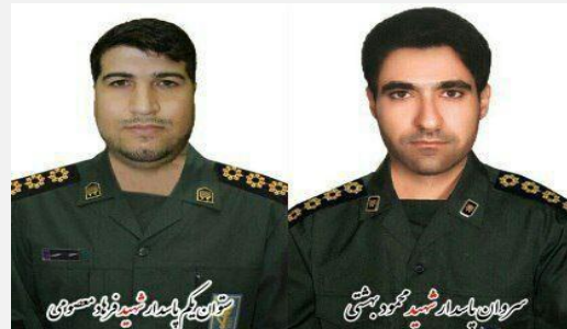
شهدای حفاظت پرواز هواپیمای آسمان