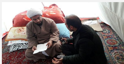
امام جمعه سرپل ذهاب: ۳ کانکس اهدایی را به ایتمام و نیازمندان دادم و در چادر با مردم همراه شدم.

آرمان : روزنامه آرمان خود با عنوان «تابوی همه‌پرسی» نوشت: «مسائلی از قبیل ایجاد رادیو و تلویزیون خصوصی، افزایش یا عدم افزایش قیمت سوخت یا نحوه توزیع یارانه‌ها چنانچه به همه‌پرسی گذاشته شود، حکایت از رشد دموکراسی و مردم‌گرایی بیشتر در یک جامعه دارد» مطرح کردن موضوع «برگزاری رفراندوم در مسائل مختلف» از سوی دولتمردان و روزنامه‌های اصلاح طلب در حالی است که مطالبات اصلی مردم کاملاً مشخص است. در حال حاضر مطالبه اصلی مردم رفع مشکلات معیشتی و بهبود وضعیت اقتصادی است. روزنامه اصلاح طلب آرمان پیشنهاد داده است که درخصوص نحوه توزیع یارانه‌ها رفراندوم برگزار شود. این پیشنهاد که در حالت خوش بینانه از فراموشی مدیران این روزنامه حکایت دارد در حالی است که دولت یازدهم در ابتدای شروع به کار خود با تبلیغات گسترده رسانه‌ای و اعلام فراخوان عمومی بر حذف یارانه مردم عزم کرد اما با مخالفت ۹۷ درصدی مردم مواجه شد.