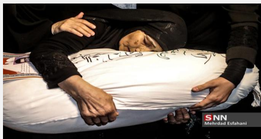
آخرین لالایی یک مادر برای فرزندش / شهید تازه تفحص شده