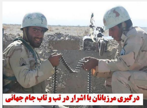
درگیری مرزبانان با اشراق در تب و تاب جام جهانی

پنجم: مقابله با فرهنگ غربی: من شنیدم لایحه‌ای را دارند تنظیم می‌کنند برای همین مسائل خانواده و اعمال خشونت علیه زنان؛ هم مسئولین دولتی، هم مسئولین مجلس، مراقب باشند که باز همان فرهنگ غربی را نخواهند اینجا پیاده کنند... از غرب نایستی تعلیم گرفته بشود. (۱۳۹۶/۱۲/۱۷) ششم. روحیه دهه ۶۰ را فراموش نکنید: خیلی از شماها از اوایل انقلاب در میدان فعالیت‌های انقلابی بوده‌اید، یعنی دهی ۶۰ را به خوبی درک کرده‌اید. [آیا] یادتان هست احساسات خودتان در آن دهه را؟ یادتان هست رفتار خودتان در آن دهه را؟ یادتان هست بی‌اعتنایی به مال را که در آن دهه داشتید؟ اهتمام به خدمت را که در آن دهه داشتید؟ یادمان می‌رود؛ این اشکال کار است. (۱۳۹۷/۰۱/۲۰)